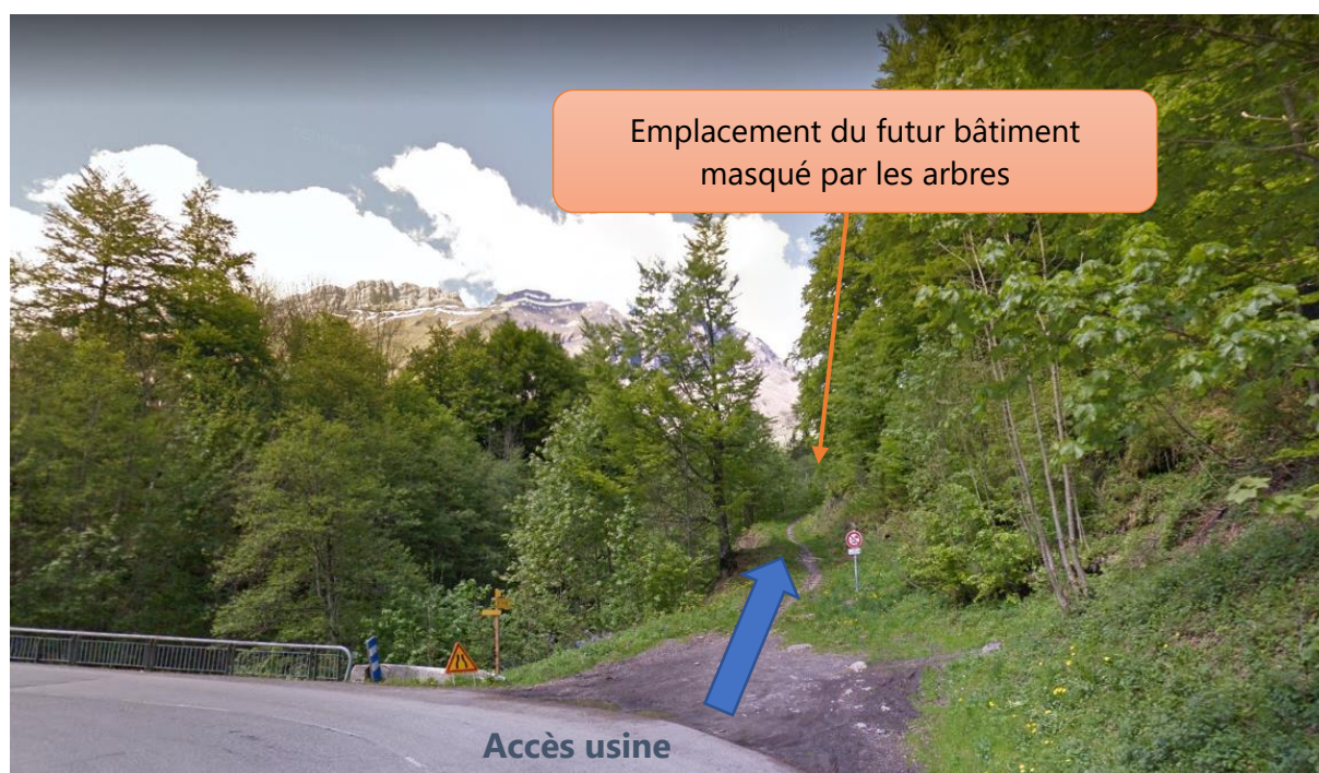
Figure 3: Vue du bâtiment depuis la D909