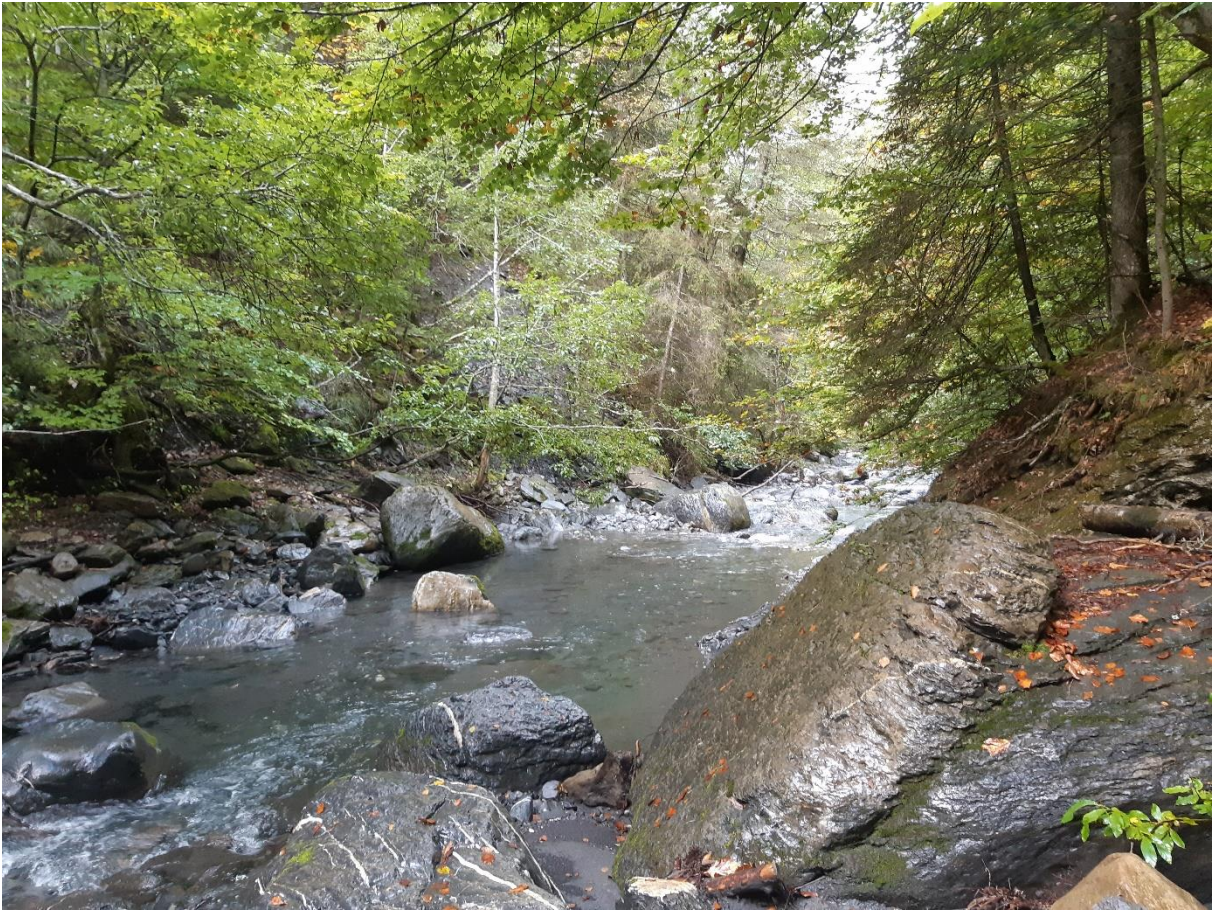
Figure 1: L'Arrondine au niveau de la future prise d'eau