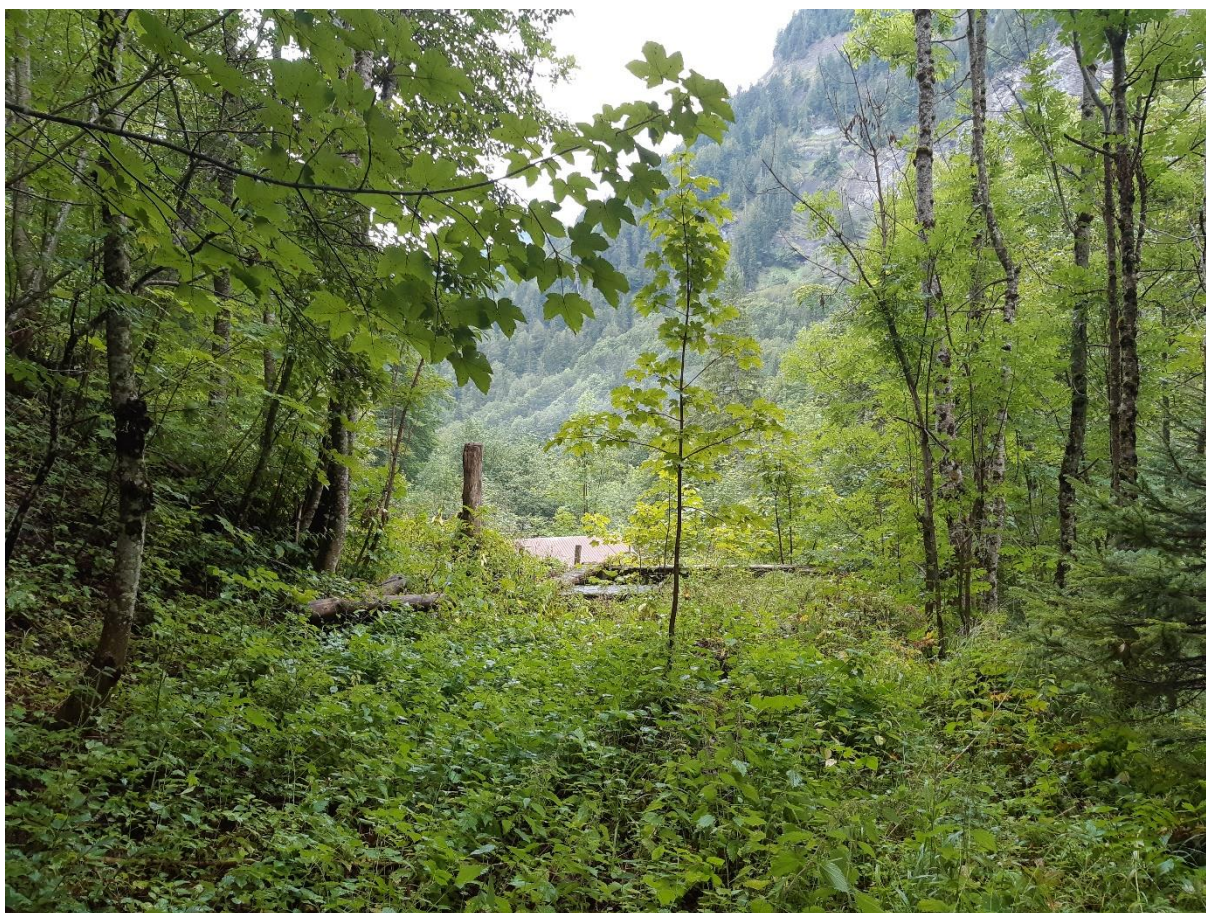
Figure 2: Emplacement du futur bâtiment usine